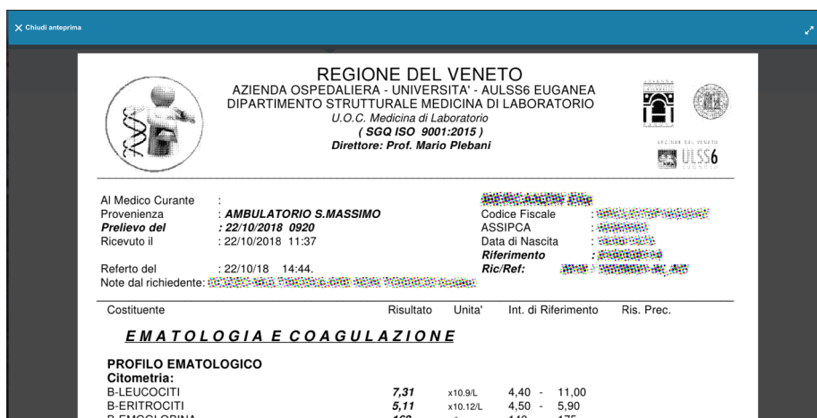
Finestra di visualizzazione documento.

L'operatore potrà esclusivamente consultare i documenti. Il visualizzatore, infatti nel rispetto della normativa vigente, non prevede la stampa o lo scarico dei documenti .