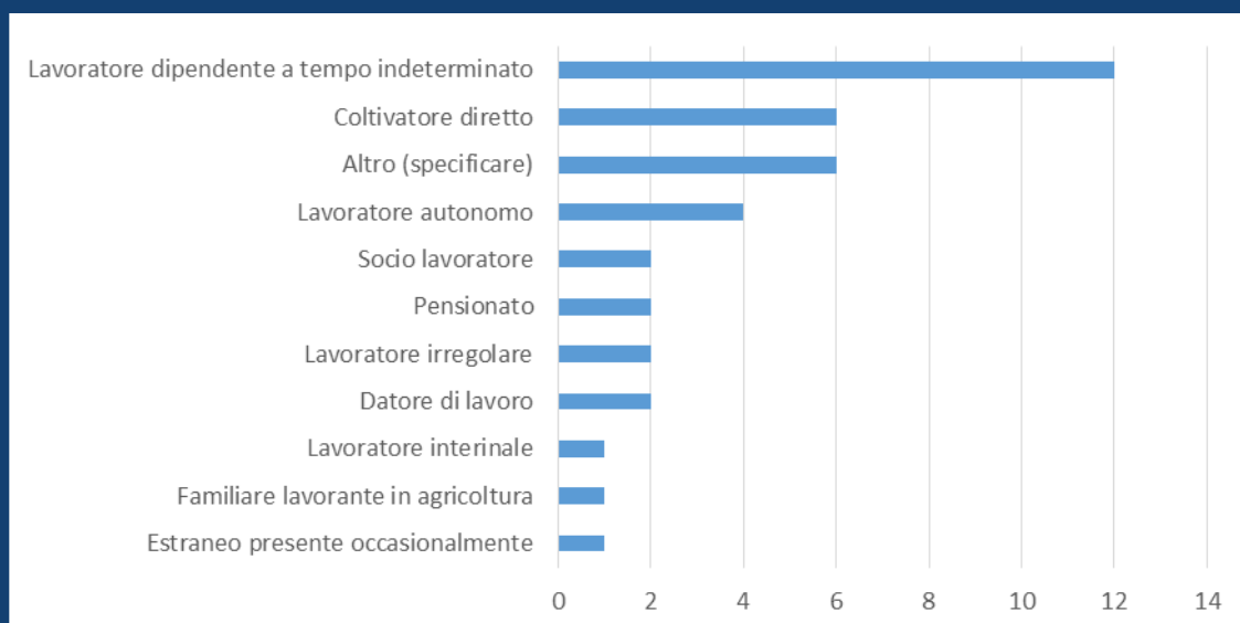
Distribuzione degli infortuni mortali nella Regione del Veneto per ruolo. Gennaio - Novembre 2022