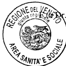
Fig. Domenico Mantoan